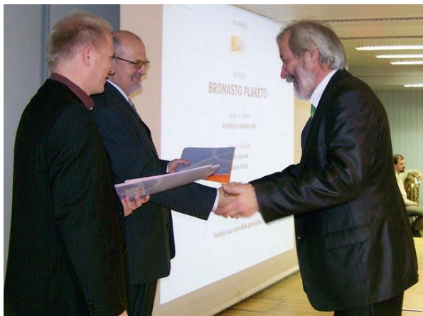
Podelitev priznanja za najboljšega mentorja na natečaju Eureka mladi! 2009