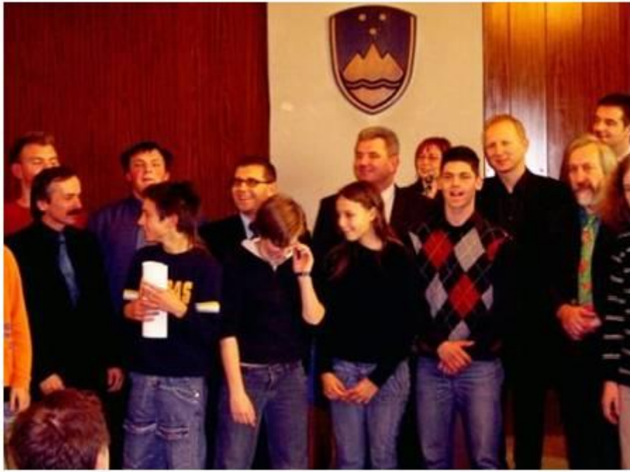
Podelitev nagrad Eureka! 2006