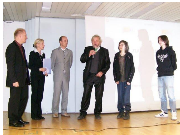
Podelitev priznanj, plaket in nagrad na natečaju Eureka mladi! 2009