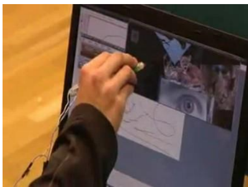
Delovanje IR Interaktivne table