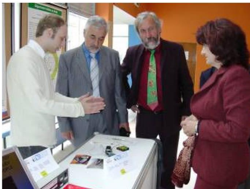
Komisija si je predstavljene projekte z zanimanjem ogledala