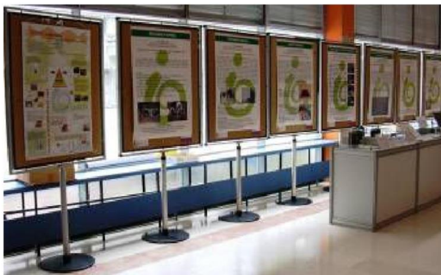
Predstavitev slovenskih projektov