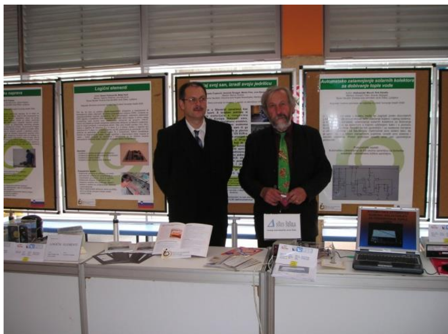
Predstavitev raziskovalnih nalog in inovativnih projektov na INOVA 2007 v Zagrebu

V letih 2006 in 2007 smo predstavljali inovativne projekte na Hrvaškem v okviru festivala INOVA ter prejeli zlata, srebrna in bronasta odličja. Republiko Slovenijo in našo šolo smo predstavljali tudi na praznovanju 150-letnice rojstva legendarnega izumitelja Nikole Tesle. Brez dobrih mentorjev, vodene raziskovalne dejavnosti, povezave z Mestno občino Ljubljana, z gospodarstvom ter ustanovami, kot so Inštitut za inovativnost in tehnologijo, Slovenska znanstvena fundacija, Ministrstvo za visoko šolstvo, znanost in tehnologijo, Zveza za tehnično kulturo Slovenije, Fakulteta za elektrotehniko, ki razpisujejo tekmovanja in natečaje, na osnovi katerih dobimo tudi sredstva, ne moremo pričakovati uspeha. Pri tem je pomembna tudi strategija vodstva šole.